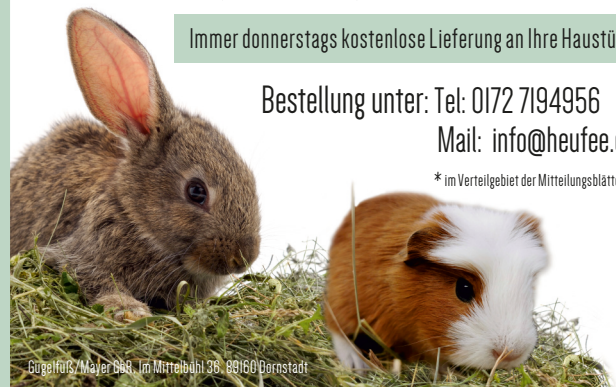
Göggelhub/Mayer 2008, Im Mittelbühl 36, 89160 Dornstadt

* im Verteilgebiet der Mitteilungsblätter