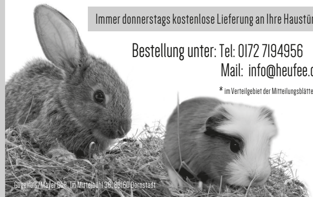
Gügelhals/Majer B&B, Im Mittelbühl 38, 89160 Dornstadt

* im Verteilgebiet der Mitteilungsblätter