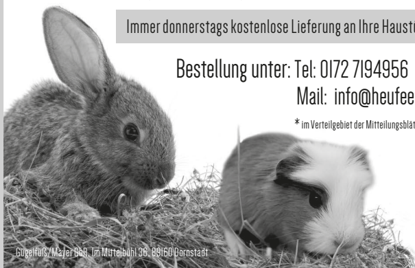
GugelFutts/Mater 966, Im Mittelbühl 96, 89160 Dornstadt

*im Verteilgebiet der Mitteilungsblätter